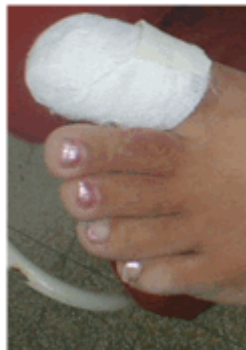
Figura 19. Vendado.