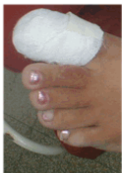
Figura 19. Vendado.