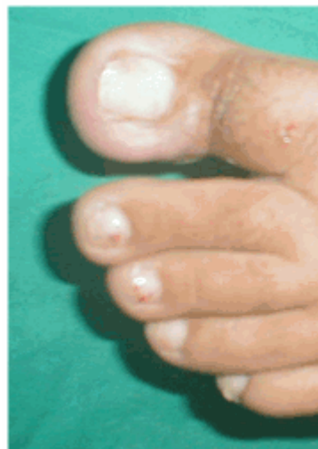
Figura 21. Evolución a los 10 días

La segunda cura se realizó a las 96 horas. Se descubrió la lesión, se examinó el estado de evolución y se procedió a realizar una cura seca con alcohol 75 % (Figura 20). Se le indicó continuar con las curas durante 10 días.