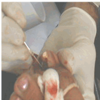
Figura 7. Corte longitudinal del lateral externo de la uña encarnada.