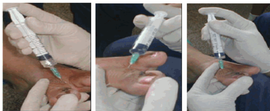
Figuras. 3, 4 y 5. Muestran la técnica de bloqueo del primer dedo.

Se realizó bloqueo anestésico con infiltración troncular en forma de H, utilizando lidocaína al 2 %, a dosis de 1cc por cada infiltración. (Figuras 3, 4, 5).