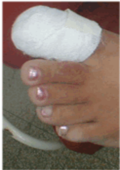
Figura 19. Vendado.