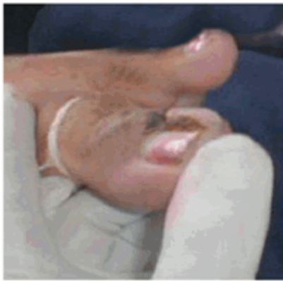
Figura 6. Hemostasia por barrido.

Seguidamente de conseguir la isquemia se realizó un corte longitudinal del lateral externo de la uña encarnada, que se extendió desde el borde distal del dedo hasta la zona de la raíz ungueal. Esta técnica se realizó siempre con el filo del bisturí hacia arriba y cuando se llegó a la cutícula se hizo una ligera rotación hacia la placa ungueal para penetrar por debajo de esta sin dañarla (Figura 7). A continuación se utilizó una sonda acanalada o explorador para separar las porciones ungueales seccionadas y liberarlas (Figura 8), finalizando con la extracción de la espícula ungueal mediante una pinza mosquito recta o curva. 9,11,12,14 (Figura 9).