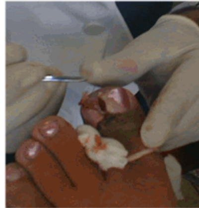
Figura 8. Utilización de una sonda acanalada o explorador para separar las porciones ungueales seccionadas y liberarlas.

Seguidamente de conseguir la isquemia se realizó un corte longitudinal del lateral externo de la uña encarnada, que se extendió desde el borde distal del dedo hasta la zona de la raíz ungueal. Esta técnica se realizó siempre con el filo del bisturí hacia arriba y cuando se llegó a la cutícula se hizo una ligera rotación hacia la placa ungueal para penetrar por debajo de esta sin dañarla (Figura 7). A continuación se utilizó una sonda acanalada o explorador para separar las porciones ungueales seccionadas y liberarlas (Figura 8), finalizando con la extracción de la espícula ungueal mediante una pinza mosquito recta o curva. 9,11,12,14 (Figura 9).