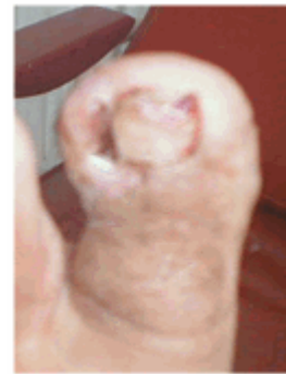
Figura 16. Lesión descubierta.