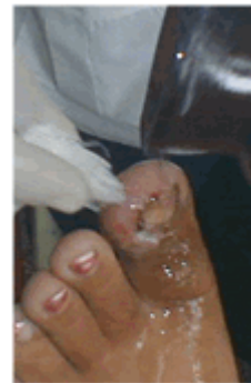
Figura 17. Lavado de la lesión

Se le indicó tratamiento con azitromicina 125 mg (1 cap. cada 12 horas) por 7 días.