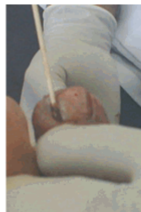
Figura 12. Aplicación del fenol al 80 %

Tras el legrado se confrontó el borde contra la uña y se comprobó la nueva posición del borde ungueal y de la uña. Se planificó la retirada del mamelón, que en este caso incluyó la extracción del granuloma. (Figura 11).