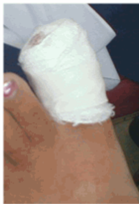
Figura 15. Vendaje