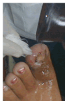
Figura 17. Lavado de la lesión

Se le indicó tratamiento con azitromicina 125 mg (1 cap. cada 12 horas) por 7 días.