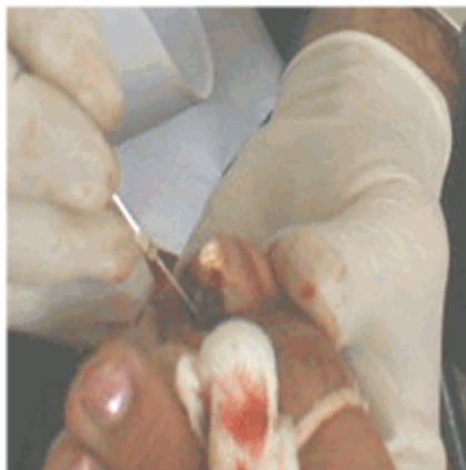
Figura 7. Corte longitudinal del lateral externo de la uña encarnada.