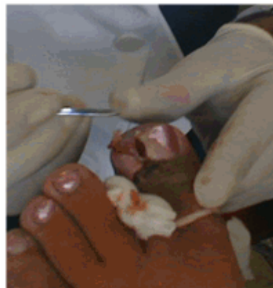
Figura 8. Utilización de una sonda acanalada o explorador para separar las porciones ungueales seccionadas y liberarlas.

Seguidamente de conseguir la isquemia se realizó un corte longitudinal del lateral externo de la uña encarnada, que se extendió desde el borde distal del dedo hasta la zona de la raíz ungueal. Esta técnica se realizó siempre con el filo del bisturí hacia arriba y cuando se llegó a la cutícula se hizo una ligera rotación hacia la placa ungueal para penetrar por debajo de esta sin dañarla (Figura 7). A continuación se utilizó una sonda acanalada o explorador para separar las porciones ungueales seccionadas y liberarlas (Figura 8), finalizando con la extracción de la espícula ungueal mediante una pinza mosquito recta o curva. 9,11,12,14 (Figura 9).