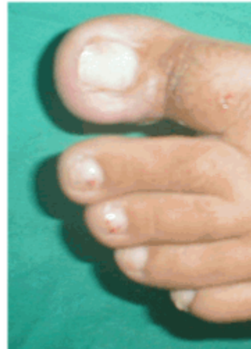
Figura 21. Evolución a los 10 días

La segunda cura se realizó a las 96 horas. Se descubrió la lesión, se examinó el estado de evolución y se procedió a realizar una cura seca con alcohol 75 % (Figura 20). Se le indicó continuar con las curas durante 10 días.