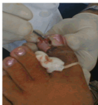
Figura 11. Reconstrucción del canal ungueal

Tras el legrado se confrontó el borde contra la uña y se comprobó la nueva posición del borde ungueal y de la uña. Se planificó la retirada del mamelón, que en este caso incluyó la extracción del granuloma. (Figura 11).