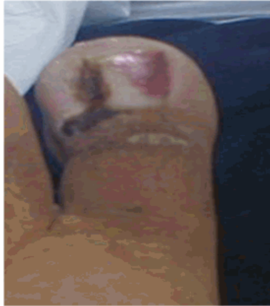
Figura 1. Imagen que muestra onicocriptosis unilateral con granuloma piógeno

Al examen físico se constató onicocriptosis unilateral con granuloma piógeno. (Figura 1).