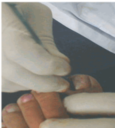
Figura 10. Legrado del surco ungueal.