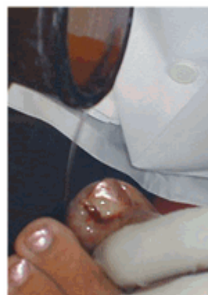
Figura 13. Lavado con alcohol 90°

Posteriormente se realizó la aplicación del fenol al 80 %, en el borde y surco ungueal llegando hasta la matriz durante 45 segundos. (Figura 12) Después se lavó con alcohol 90° para neutralizar el efecto residual del fenol. (Figura 13) Una vez realizado esto se legró nuevamente para escorear el lecho y matriz ungueal con el propósito de destruir células germinativas. Esta técnica de fenolización se repitió una vez más. 3,4