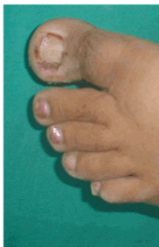
Figura 20. Segunda cura.

La segunda cura se realizó a las 96 horas. Se descubrió la lesión, se examinó el estado de evolución y se procedió a realizar una cura seca con alcohol 75 % (Figura 20). Se le indicó continuar con las curas durante 10 días.