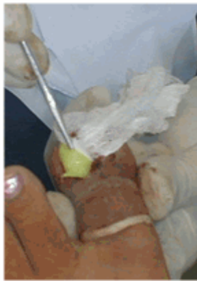
Figura 14. Colocación de la mecha