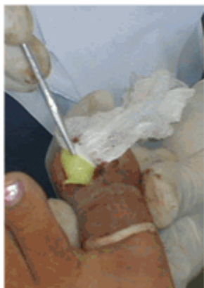
Figura 14. Colocación de la mecha