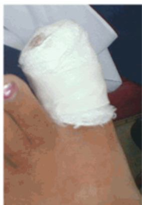
Figura 15. Vendaje