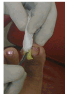
Figura 18. Colocación de nueva mecha.

A las 48 horas de la intervención se realizó la primera cura. Después de descubierta la lesión (Figura 16) se retiró la mecha, se lavó la zona con alcohol 75 % u otro tipo de antiséptico (Figura 17), posteriormente se colocó una nueva mecha en el surco ungueal con crema antibiótica (Figura 18) y se procedió a vendar la lesión. (Figura 19).