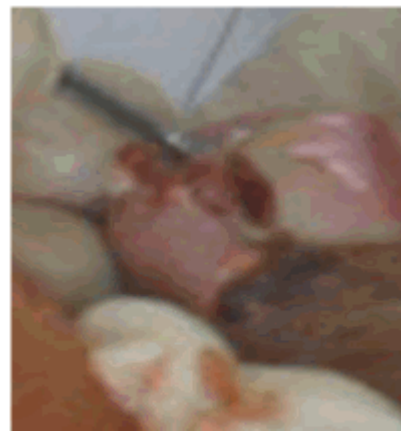
Figura 2. Imagen que muestra mamelón unilateral de aproximadamente 0,5 cm de diámetro circular, que presenta una hipertrofia que cubre la lesión.

En la consulta de podología se observó onicocriptosis unilateral externa de la uña del primer dedo del pie izquierdo, con tumefacción, enrojecimiento, aumento de la temperatura local, tumoración y dolor. Existía mamelón unilateral de aproximadamente 0,5 cm de diámetro circular, que presentaba una hipertrofia cubriendo la lesión. No existía dolor en la zona, la consistencia era blanda a la palpación, que provocaba un leve sangrado. (Figura 2).