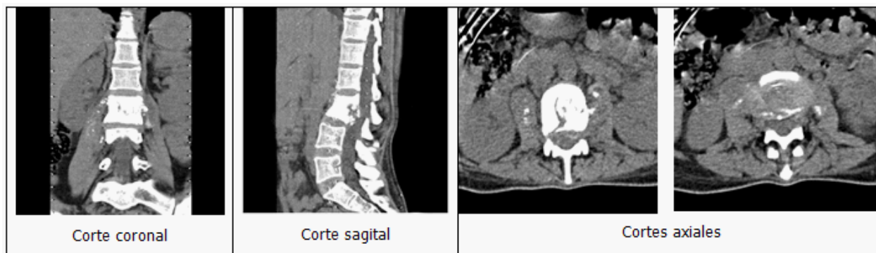
Figura 2. Tomografía axial computarizada multicorte de columna lumbosacra.

Dada la imagen encontrada en los estudios realizados, la paciente fue interrogada nuevamente y su familiar acompañante refirió que hacía un mes le habían diagnosticado tuberculosis por esputo BAAR codificación 6. Estaba concluyendo el primer mes de tratamiento y comenzando la segunda fase de este.