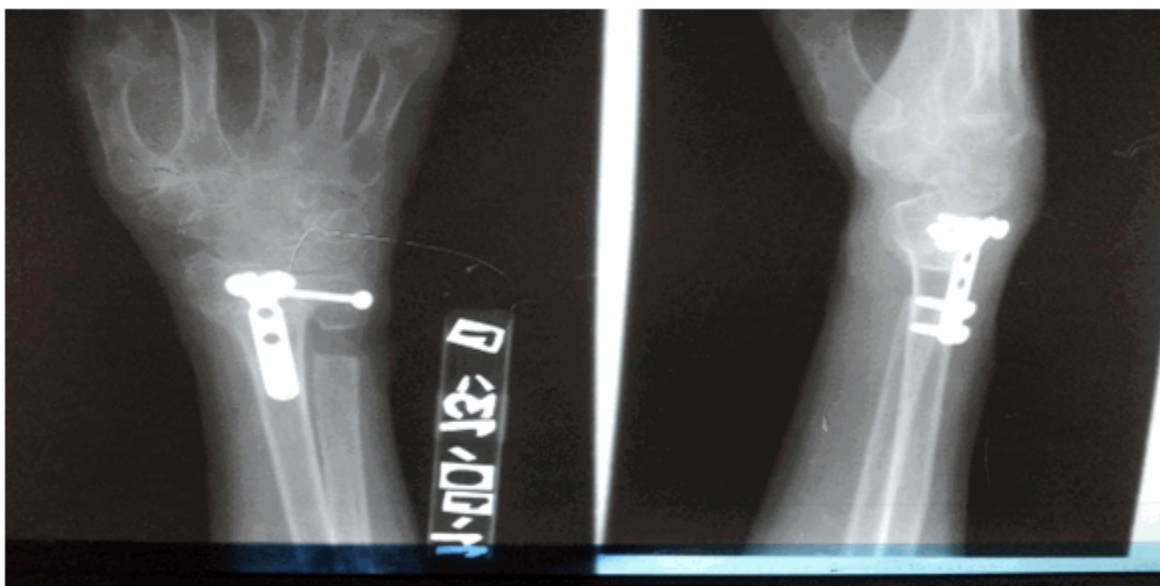
Figuras 5 y 6. Imágenes que muestran el aspecto radiológico de la mano afectada, tras la realización del procedimiento quirúrgico.

Sauvé-Kapandji 9 para corregir los trastornos de la articulación radio-cubital distal, se empleó para la osteosíntesis de la osteotomía una lámina en T de cuatro orificios con tornillos 2,5 mm; además se utilizó un tornillo maleolar de la medida adecuada para estabilizar la artrodesis radio-cubital distal. (Figuras 5 y 6).