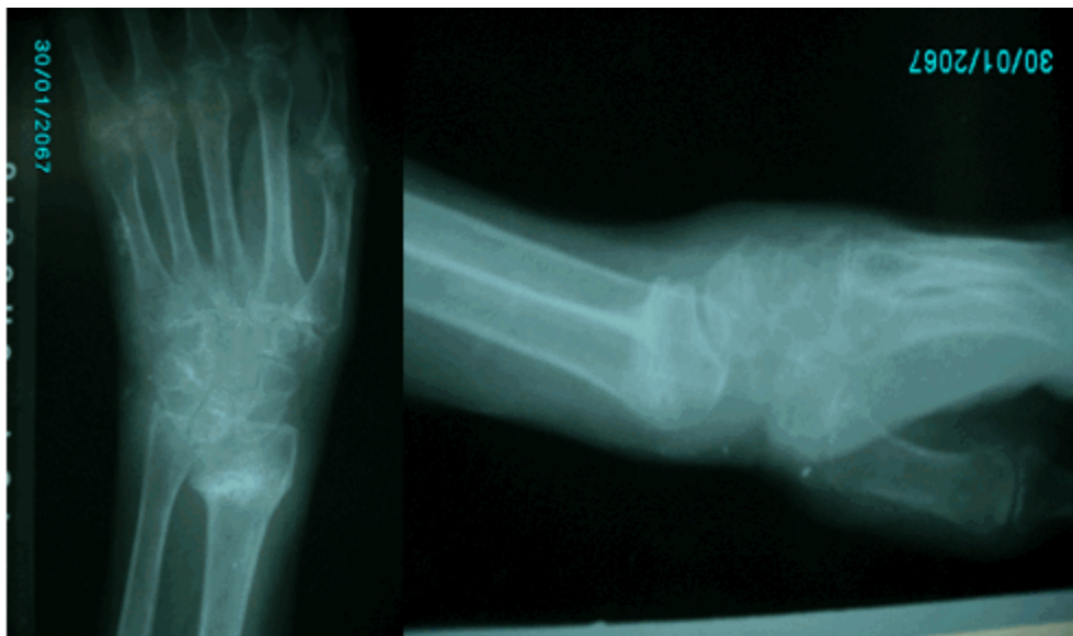
Figuras 3 y 4. Imágenes radiográficas en vista antero posterior y lateral que muestran la varianza radio-cubital, la alteración de la articulación radio-cubital y la inclinación anómala de la fosa lunar del radio en sentido dorsal.

Tras valorar el caso se decidió realizar una cirugía de rescate consistente en la osteotomía del extremo distal del radio de base dorsal con aporte de injerto según lo propuesto en la técnica de Fernández 8 y de esta manera restablecer la angulación normal de la fosa lunar del mismo, además se empleó una técnica de