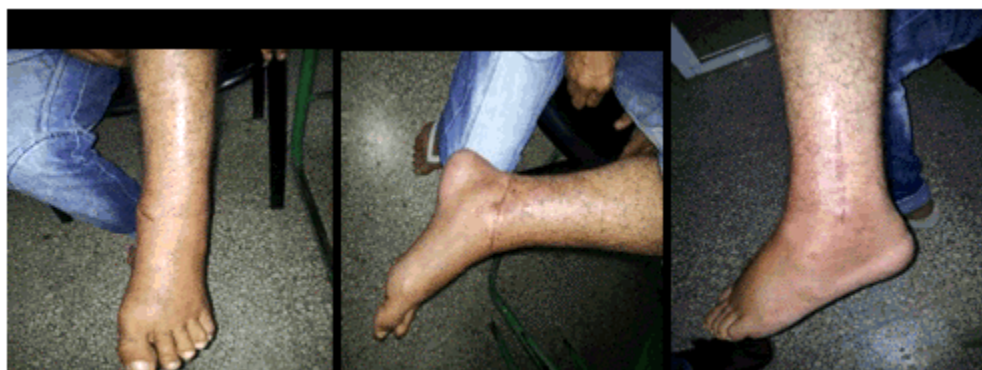
Figuras 5, 6 y 7. Imágenes donde se muestra el tobillo a los tres meses de la cirugía.

A los tres meses de la cirugía, el tobillo estaba prácticamente recuperado.(Figuras 5, 6 y 7).