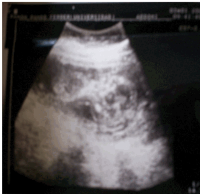
Figura 1. Imagen de una TN aumentada en producto con síndrome de Down diagnosticado prenatalmente.

El total de anomalías cromosómicas presentadas en la provincia en el período bajo estudio fue de 56, de ellas con una TN mayor de 3 mm se presentaron siete, que representan el 12,5 % del total, así como en el rango de valores de TN entre 2,5-2,9 mm, se encontró igual número de casos. La TN por debajo de los 2,4 mm se observó en el 60,7 % de las cromosomopatías y en 14,3 % (8 casos) no se conocía el dato específico, por no encontrarse registrado en la estadística del centro municipal, pero el USIT fue normal, por lo que en general el 75 % tuvieron TN normal.