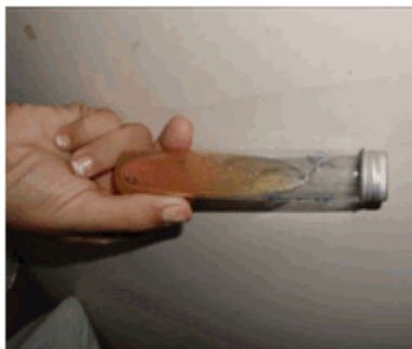
Figura 1. Se muestra crecimiento en la superficie del medio de cultivo, con características morfológicas de la Rhodotorula . Objeto de 40. Tipo de microscopio: Olympus.