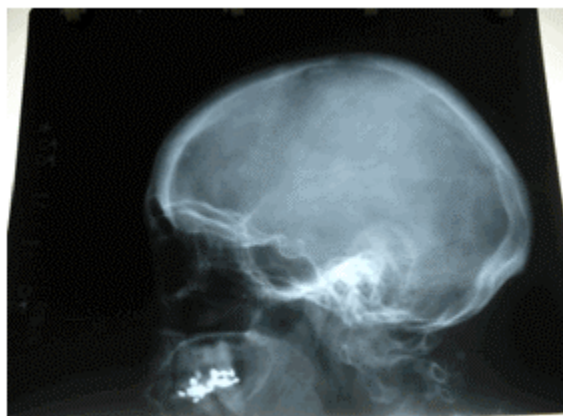
Figura 1. Radiografía que muestra la ausencia de alteraciones en la silla turca.

Radiografía de tórax posteroanterior (PA): Sin alteraciones bronquiales ni pleuropulmonares. Índice cardiotorácico dentro de límites normales. Radiografía de cráneo anteroposterior (AP): Sin alteraciones de estructuras óseas de la bóveda craneana. Radiografía de cráneo vista lateral: No se observaron alteraciones radiológicas. Radiografía de silla turca: No se observaron alteraciones de la silla turca. (Figura 1).