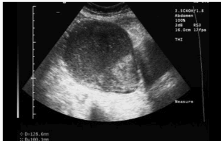
Figura 1. Imagen ecográfica que muestra gran distensión de la cavidad uterina.

A continuación se le practicó una tomografía del abdomen y pelvis, con el hallazgo de una masa