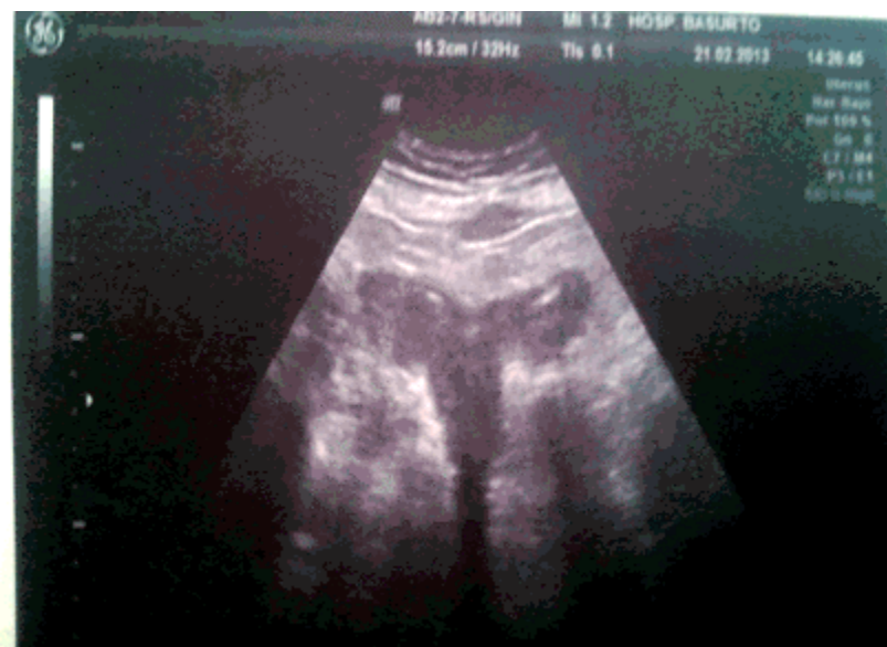
Figura 3. El vaciado parcial de la piometra pone en evidencia un útero bicorne.

que reveló, durante las últimas fases de la evacuación, la existencia de un útero bicorne. (Figura 3).