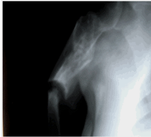
Figura 1. Imagen radiográfica que muestra pérdida de la continuidad ósea entre el tercio proximal y el tercio medio humeral; con esclerosis de los bordes óseos, cierre del canal endomedular y atrofia del extremo distal del húmero a nivel del foco pseudoartrótico.

Los exámenes complementarios preoperatorios mostraron: