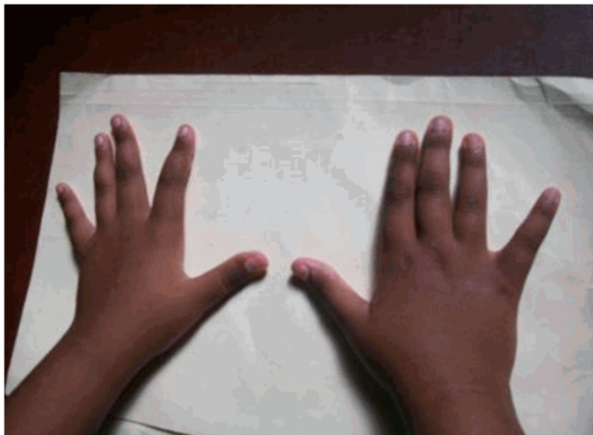
Figura 2. Imagen que muestra las manos finas en cono, en las falanges distales.

Llama la atención la obesidad en tronco y extremidades en la parte proximal. Sin embargo tuvo siempre un crecimiento pondoestatural acorde a su edad y sexo y en este momento