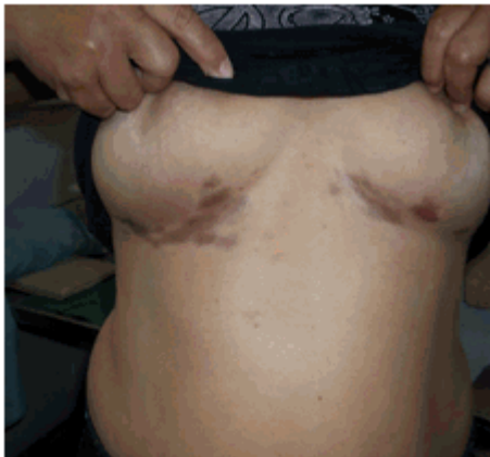
Figura 1. Máculas hipercrómicas simétricas y bilaterales.

Pliegues submamarios: lesiones hipercrómicas: tonalidad del violeta al marrón, con predominio del derecho, simétricas y bilaterales, ovaladas, en número de 5 a 9 por pliegue, que confluyen y adoptan una disposición lineal, bordes regulares y bien definidos, superficie lisa y brillante, aunque discretamente rugosa y blanquecina en el centro de algunas máculas, identificadas con la lupa como pápulas puntiformes marrones, escasas en número, intercaladas con otras blancas. (Figuras 1 y 2).