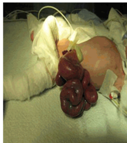
Figura 1. Gran defecto de pared abdominal anterior, con evisceración.

En las primeras horas de nacida, ingresó en cuidados intensivos neonatales del Hospital General Karl Heusner Memorial, de Belice, una niña con color de la piel blanco, primogénita, con peso de 1 860 gr, procedente del distrito de Corozal, por un onfalocele gigante, de 12 cm de diámetro, (Figura 1) y toma del estado general. A las 10 horas se produjo su rotura por lo que se solicitó su evaluación por servicio de Cirugía.