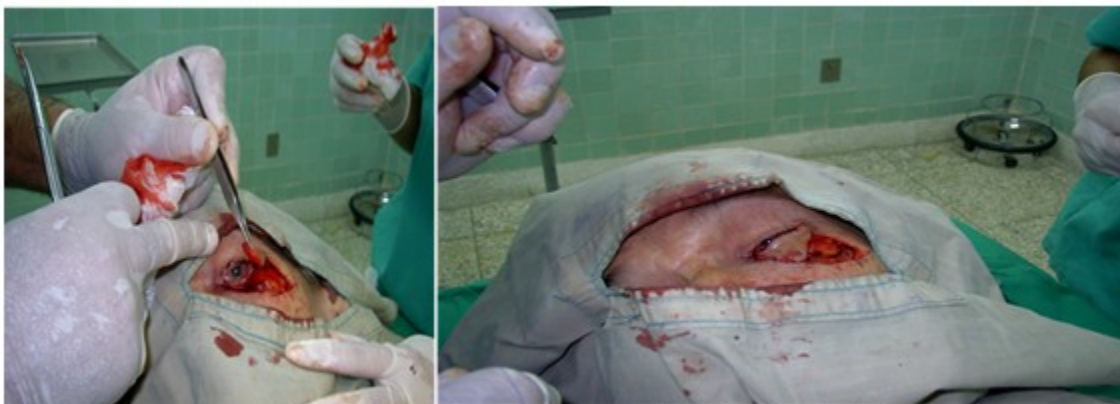
Figura 2. Momentos del acto quirúrgico que muestran la aplicación de la técnica descrita.

De los 15 pacientes operados, 9 fueron mujeres y 6 hombres, todos de color de la piel blanco, con edades comprendidas entre 60 y 80 años. En todos se utilizó colgajo miocutáneo, acompañado de una fina lámina de cartílago de la concha auricular. De los 15 pacientes operados solo uno tuvo una evolución tórpida, pero al final el resultado fue satisfactorio. (Figura 2, Figura 3).