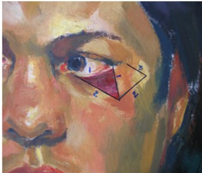
Figura 1. Diseño de la técnica modificada. El punto 2 corresponde a la altura del lecho. El punto 3 es llevado a ocupar el borde inferior de la herida.

Esta investigación contó con la aprobación del Consejo Científico del Hospital. Las imágenes y datos han sido utilizados previo consentimiento informado a los pacientes.