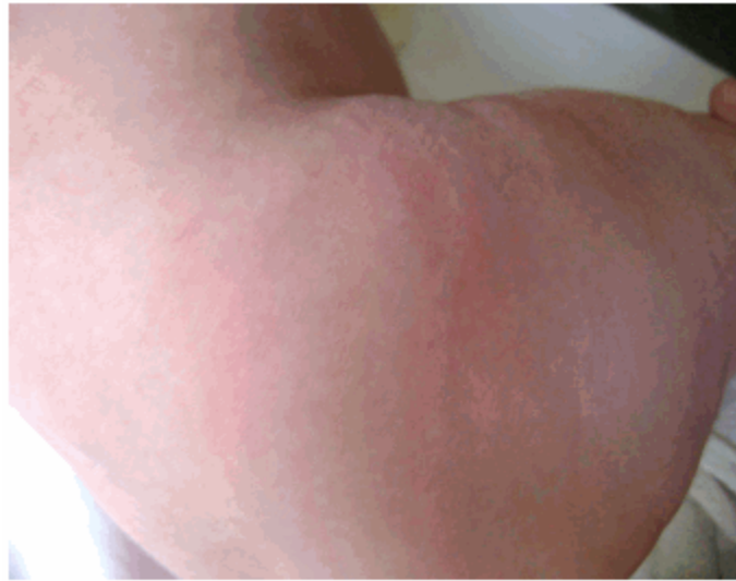
Figura 2. Nódulos eritematosos a nivel de cadera derecha.

Tejido celular subcutáneo: infiltrado, de consistencia firme y móvil, a nivel de lesiones cutáneas.