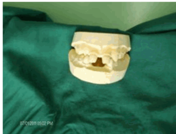
Figura 1. Modelos de estudio del primer caso clínico

molares y caninos temporales están presentes, estos últimos con forma de cono. (Figura 1)