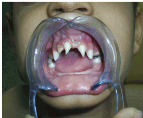
Figura 4. Oligodontias y dientes con formas anómalas.

Al examen bucal del maxilar, se observó la presencia de cuatro dientes de forma conoide en el sector anterior y cuatro molares en el sector posterior, dos a cada lado; en la mandíbula se observaron cuatro molares y ausencia total del resto de los dientes. (Figuras 4 y 5)