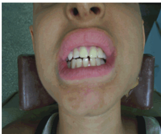
Figura 7. Instalación.