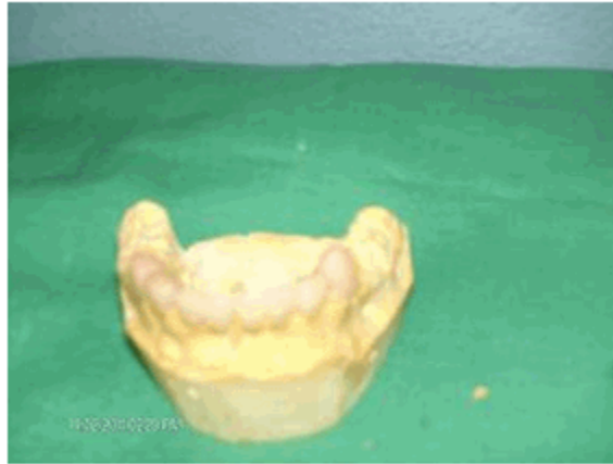
Figura 9. Encerado del puente parcial fijo provisional.

realizar preparaciones dentarias. (Figuras 9 y 10) En el maxilar se colocó mantenedor de espacio para reponer 12 y 22. De este modo se logró rehabilitar estética, funcional y psicológicamente al paciente.