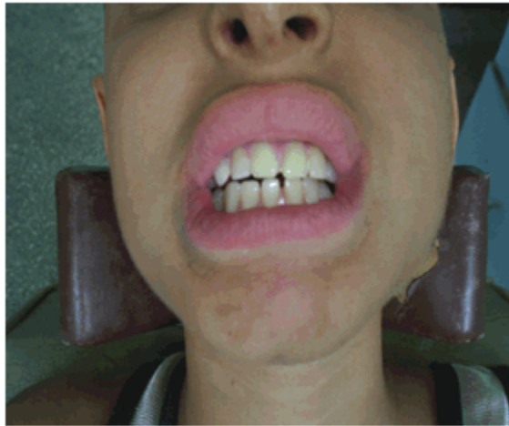
Figura 7. Instalación.