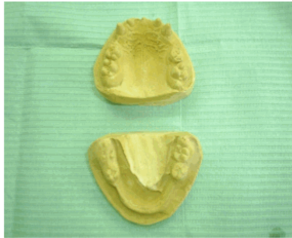
Figura 5. Modelos de estudio del segundo caso clínico.

La radiografía panorámica ratificó las observaciones realizadas en el examen bucal y aportó la ausencia de folículos y brotes dentarios que pudieran impedir el recambio.