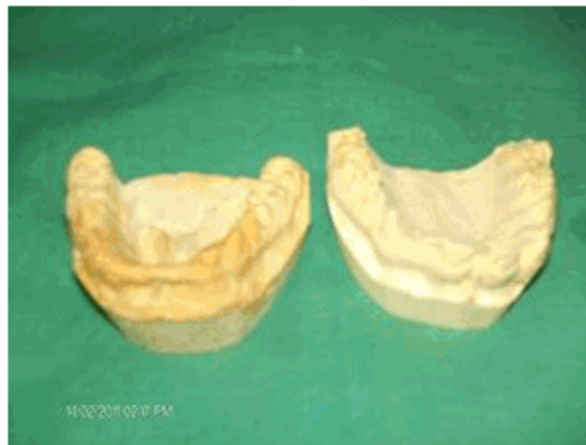
Figura 8. Modelos de estudio del tercer caso.

Al examen bucal se observó oligodoncia de los incisivos laterales superiores y forma conoide de los caninos superiores. En la mandíbula los cuatro incisivos inferiores estaban ausentes, con una amplia brecha edente; los caninos y primeras bicúspides inferiores, también mostraron forma conoide; los molares inferiores estaban presentes. (Figura 8)