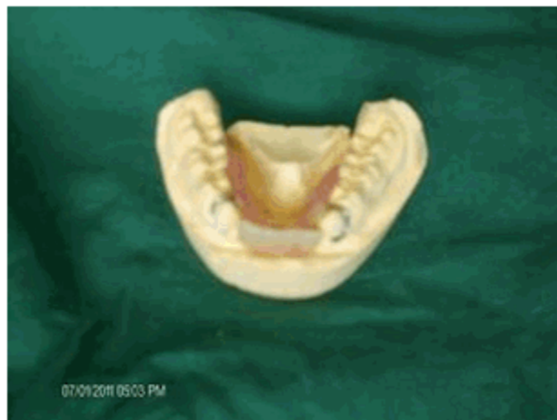
Figura 2. Prótesis parcial deacrílico inferior del primer caso.

familiares, se consideró oportuno realizar una prótesis parcial deacrílico inferior con unos retenedores de acero labrados en algunos de los dientes presentes en las arcadas, lo que permitiría introducir algunas modificaciones de ser necesario. (Figuras 2 y 3)