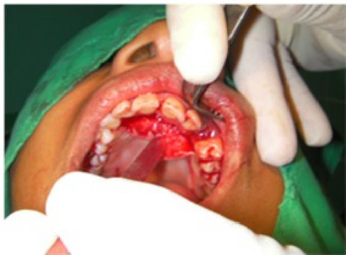
Figura 6. Se realizó el abordaje por palatino

Hasta este momento quedó la porción coronal hacia la zona de palatino. Se realizó incisión festoneada por palatino desde 14 hasta 24 decolado del mucoperiostio, se efectuó osteotomía por palatino con airotor mediante la apertura de una pequeña ventana en el tercio medio radicular de 21 y 22. (Figuras 6 y 7).