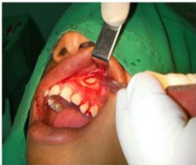
Figura 4. Se realizó ostectomía y localización de la porción radicular

En este paso se realizó decolado del mucoperiostio, ostectomía y odontosección radicular en 2 porciones, se realizó la exéresis radicular. (Figuras 4 y 5).