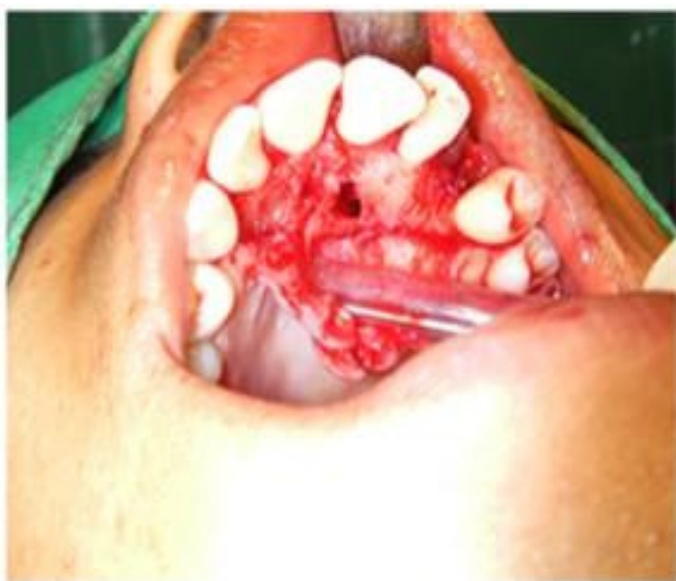
Figura 8. Se conservó la cortical palatina

Para realizar hemostasia, se utilizó hidroxiapatita como material biocompatible de relleno y se suturó con seda 4-0. La duración de la intervención se concretó en 2 horas y 20 minutos. (Figura 9).