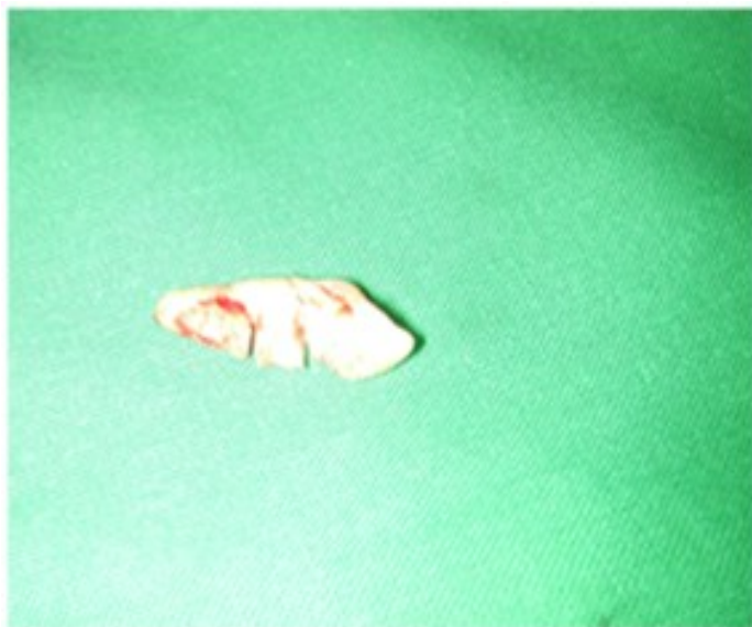
Figura 10. Imagen del canino al dividir en 3 porciones.

Se muestra la imagen del canino fragmentado en tres porciones. (Figura 10).