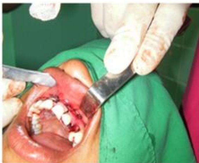
Figura 9. Se realizó hemostasia y se realizó la sutura