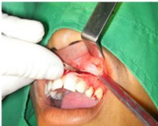
Figura 3. Se realizó la apertura por vestibular

Pasos: Se procedió a realizar la asepsia y antisepsia, se colocó paño hendido, se aplicó anestesia troncular e infiltrativa, se hizo incisión de Wasmund (semilunar modificada) por vestibular desde 24 hasta 12 y por encima del surco gingival, se respetó el frenillo medio labial. (Figura 3).