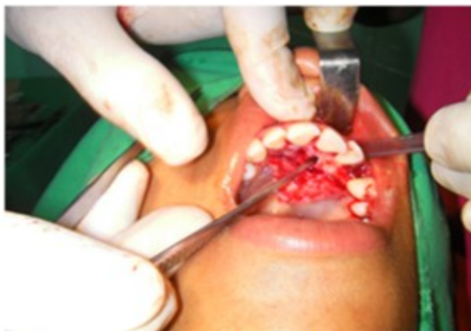
Figura 7. La corona fue impulsada hacia la abertura vestibular

Se promovió el fragmento hacia el vestíbulo, se realizó la exéresis de la porción coronal del 23, operculectomía, cureteado, limado y lavado. (Figura 8).