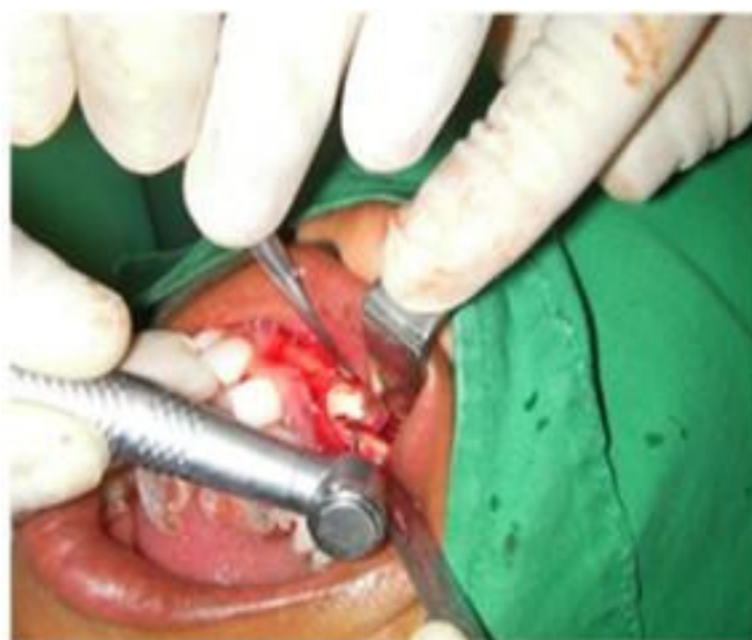
Figura 5. Se realizó la separación de su porción coronal y la exéresis de la porción radicular