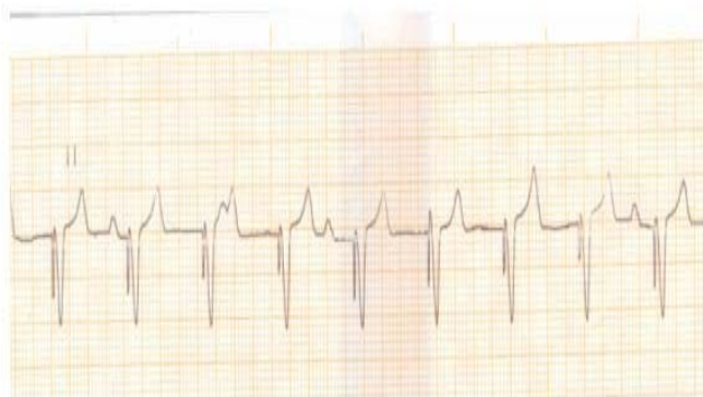
Figura 1. Ritmo del marcapasos VVI. Se observan las ondas P dissociadas con respecto a la captura ventricular, característica en un paciente con bloqueo AV completo y portador de un MP VVI.

Se implantó un marcapasos permanente (MP) unicameral modelo Diapason (Soriana) de fabricación italiana, con los parámetros nominales y modo de estimulación VVI, sensado y estimulación monopolar. Fue dado de alta con seguimiento en la consulta de marcapasos. (Figura 1).