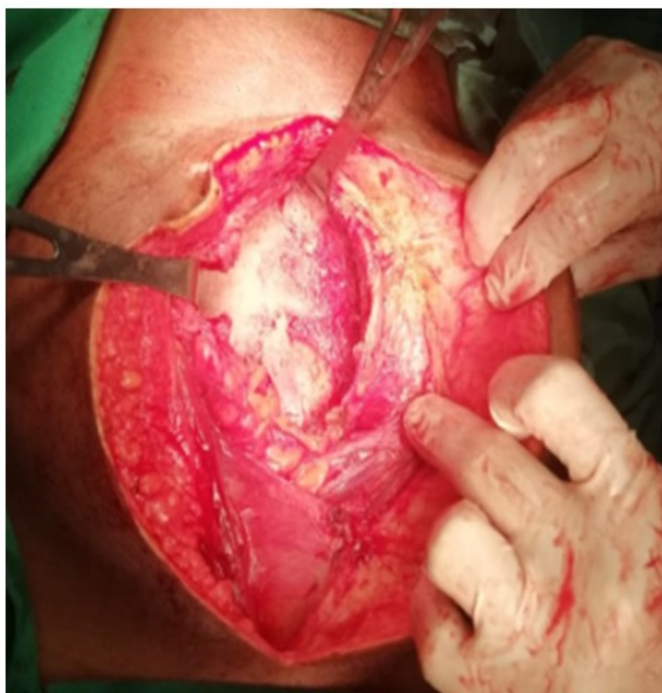
Fig. 1: Imagen que muestra lesiones granulomatosas caseosas en abdomen.

Laparotomía exploratoria: en base al diagnóstico clínico establecido, se realizó la intervención a través de incisión xifopúbica con profundización por planos hasta cavidad abdominal, apreciando dificultad para el abordaje de la cavidad peritoneal debido al engrosamiento del tejido preperitoneal; al ingresar al abdomen se evidenció abdomen congelado, con imposibilidad de acceder a los órganos intraabdominales, con presencia de capa de tejido fibrinoso engrosado vascularizado extendido a peritoneo parietal y visceral con lesiones granulomatosas y caseosas diseminadas. (Fig. 1).