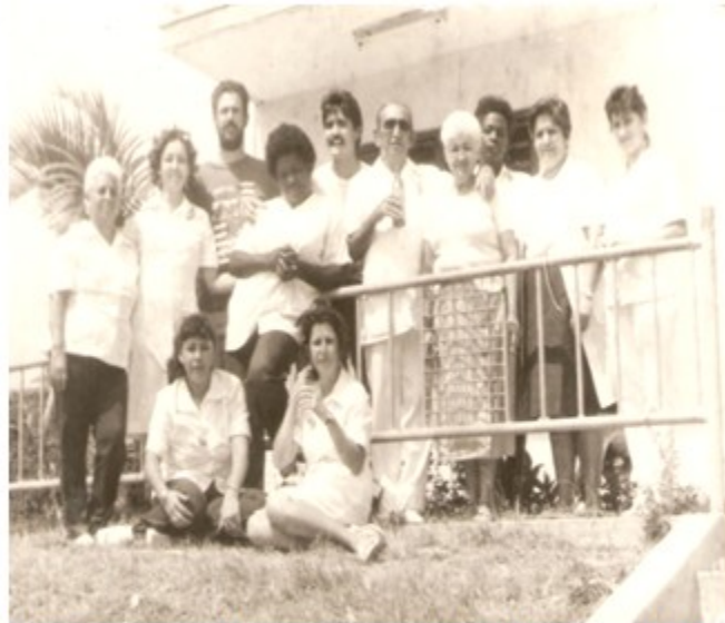
Acto por la entrega de la medalla Manuel "Piti" Fajardo