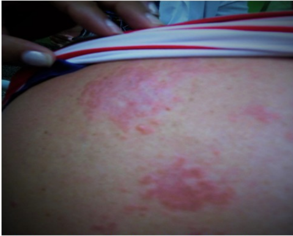
Fig. 1- Lesiones papulares eritematosas, translúcidas e infiltradas.