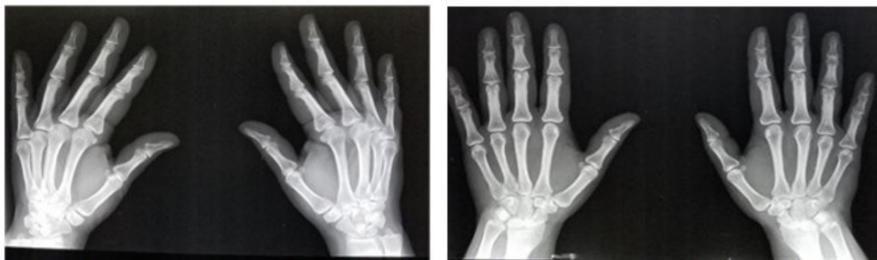
Fig. 3 y Fig. 4. Imágenes de rayos X de manos en vista superior que no muestran alteraciones en partes blandas ni óseas ni a nivel articular.

Finalmente, la paciente tuvo una interconsulta con oftalmología para descartar la posibilidad de la presencia de una uveítis como manifestación extraarticular y de las más importantes de la enfermedad en estudio. No se observaron alteraciones por espondiloartropatía; en el ojo izquierdo aparecieron cambios vasculares que comprometen la luz del vaso y microhemorragias en periferia, producto de la hipertensión arterial.