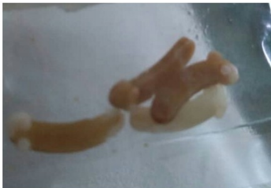
Fig. 1. Imagen que muestra clips extraídos ocho meses después de la prostatectomía radical laparoscópica.

Acudió al hospital, donde se realizó ultrasonido pélvico y se descubrieron imágenes ecogénicas no bien definidas, sugestivas de "litiasis" vesical. (Fig. 1).