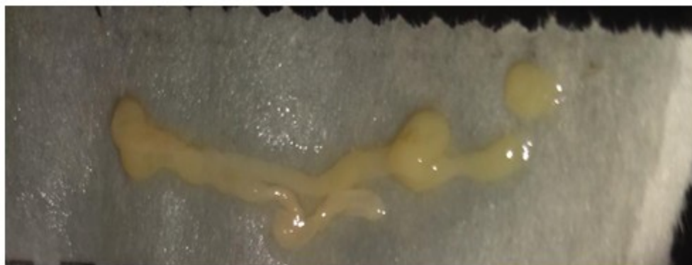
Fig. 3. Masa gelatinosa expulsada por la sonda urinaria una semana antes de la extracción del clip.