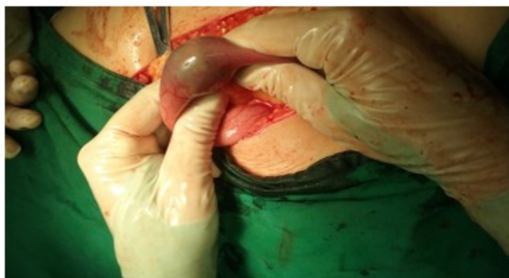
Foto 1. Muestra la imagen del cálculo dentro de la luz del intestino