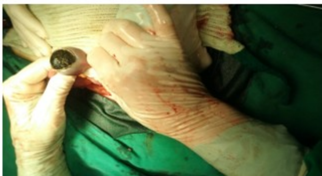
Foto 2. Momento que se realiza la extracción del cálculo