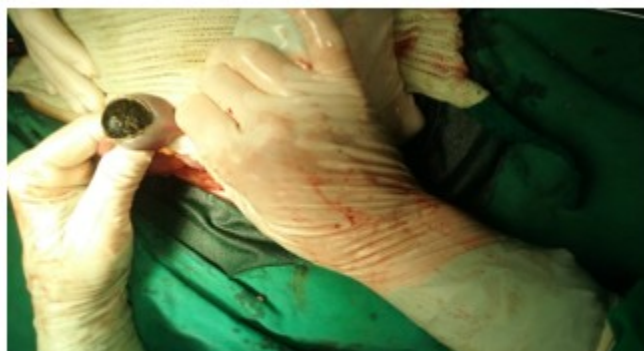
Foto 2. Momento que se realiza la extracción del cálculo