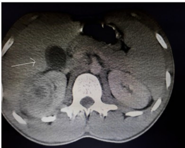
Fig. 3: Tomografía de abdomen con riñón derecho de densidad variable con imagen en contorno externo del polo superior.