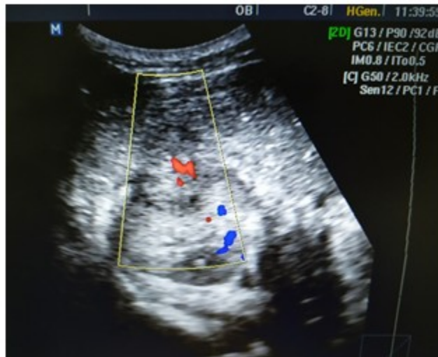
Fig. 2: Presencia de flujo sanguíneo al doppler color en imagen compleja en polo superior del riñón derecho.

3- Tomografía Axial Computarizada (TAC) de abdomen simple y contrastada (Fig. 3): hígado, bazo, páncreas, suprarrenales y riñón izquierdo normales. Se observa riñón derecho de densidad variable, con centro de menor densidad, con imagen que mide 51 x 46 mm en contorno