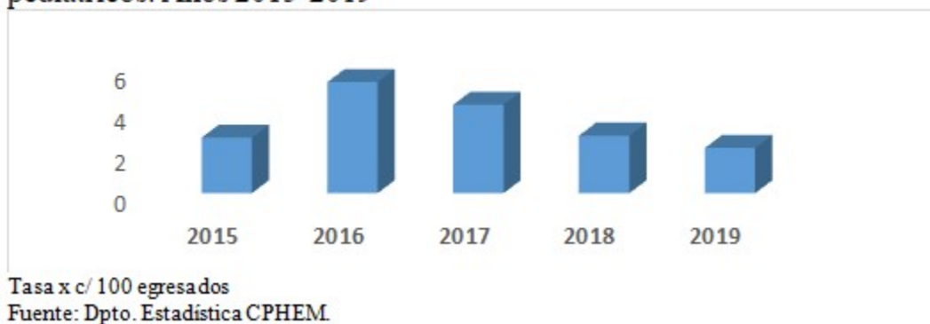
Gráfico 1. Incidencia de casos con IAAS. Unidad de Cuidados Intensivos pediátricos. Años 2015-2019

En este estudio, el grupo de edad más afectado fue el de menores de un año con un 27,3 %,