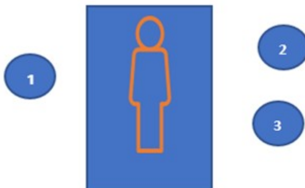
Fig. 2. Esquema de la simulación.

Ingresaban al escenario tres estudiantes, quienes bajo la consigna de ser fisioterapeutas respiratorios debían abordar al paciente evaluarlo y analizar para llegar al diagnóstico fisioterapéutico presuntivo, a los objetivos fisioterapéuticos y al desarrollo de un plan de tratamiento en fisioterapia respiratoria. Posteriormente se hizo la retroalimentación con el docente sobre la experiencia vivida, cómo se sintieron, cuáles fueron las fortalezas y debilidades, cómo se puede mejorar la intervención, el acercamiento de la teoría a la práctica y la aplicación de la escena en el campo clínico real. (Fig. 2).