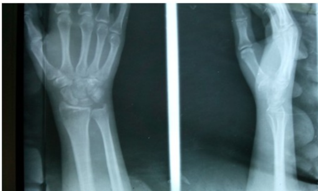
Figura 4. Imágenes radiográficas que muestran el resultado obtenido.

Se mantuvo la síntesis del escafoides por ocho semanas y se retiró la inmovilización a las 12 semanas tras obtener la consolidación de la fractura del escafoides. (Figura 4).