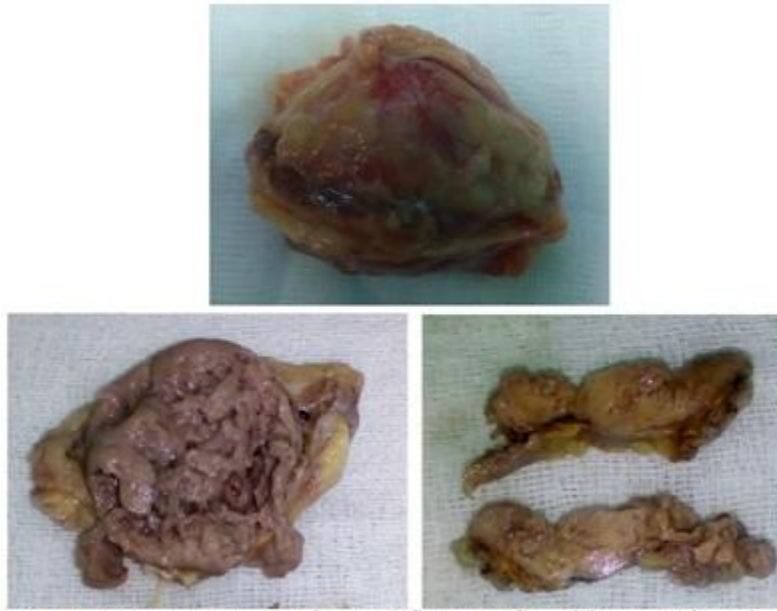
Figura 3: Imagen que muestra la anatomía macroscópica del tumor. Nótese las características externas al corte.

Tienen predominio en el lado derecho, sin conocerse la causa. En sentido general, el 90 % de estas neoplasias cromafines tienen una presentación esporádica, frente a solo un 10 % con presentación familiar. En este último caso se sabe que puede heredarse de forma aislada con herencia autosómica dominante o dentro de síndromes hereditarios, tales como: enfermedad