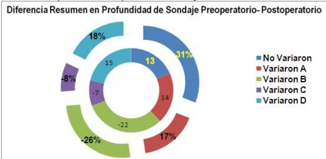
Gráfico 1. Comportamiento de la profundidad al sondaje a los seis meses

A: Profundidad al sondaje de 4 mm B: Entre 5 y 6 mm C: Mayor de 6 mm D: Menos de 4 mm