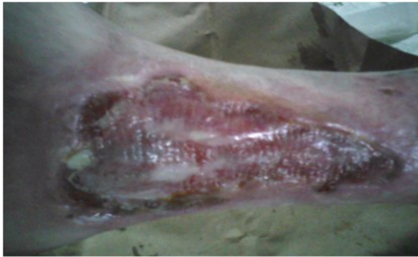
Figura 8. Aspecto adquirido por el gel de plaquetas hasta aproximadamente los cinco días.