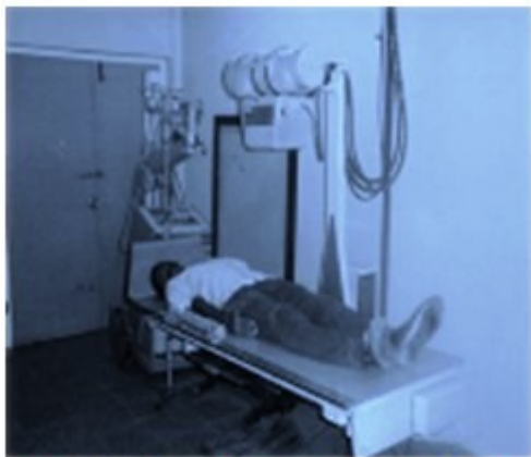
Figura 11. Equipo de rayos X convencional de Urología y equipo portátil (1979).