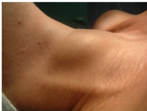
Figura 4. Vista lateral del cuello, donde se observa el aumento de volumen.

4), y que se prolongaba hacia la parte superior del tórax, no adherida a planos profundos y sin acompañarse de adenopatías.