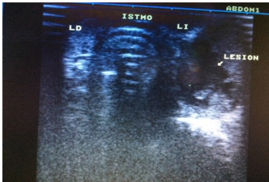
Figura 1. Ultrasonido donde se muestra la tumoración paratifoidea.

La biopsia por aspiración con aguja fina (BAAF), informó citología negativa de células neoplásicas y probable adenoma.