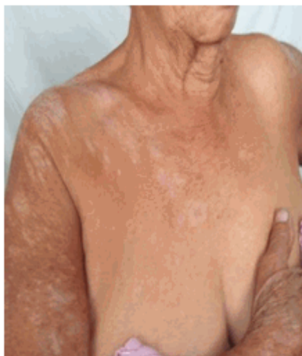
Figura 1. A. Lesiones en tórax y brazo derecho.

Lesiones maculares hipocrómicas localizadas en tórax anterior (Figura 1.A); abdomen y en espalda (Figura 1.B). Lesiones similares de mayor tamaño en superficie de extensión en miembros superiores, muslos y cara externa y pliegues de flexión de las piernas, algunas simétricas y bilaterales, entre 0,5 cm - 20 cm de diámetro; color marfileño o blanco porcelana, forma redondeada y otras ovaladas; de bordes bien regulares, definidos y algunos de ellos con un anillo a su alrededor ligeramente pigmentado; induradas con superficie algo atrófica y escamosa, blancas, pequeñas, de difícil desprendimiento, secas. (Figura 2.A). Otras placas con tapones queratósicos foliculares que simulan comedones (Figura 2.B); acompañado de prurito intenso, en paroxismos y sin relación ritmo ni horario.