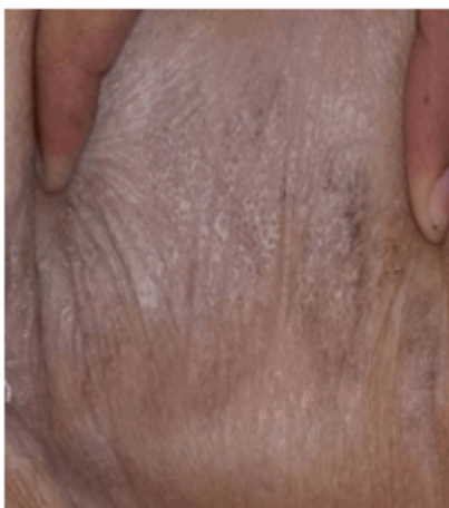
Figura 2. B. Aspecto comedónico o cribiforme

Región genital: presenta mácula acrómica que abarca casi la totalidad de los labios mayores y menores; bordes bien definidos, los cuales se extienden fuera de estos aproximadamente 2,5 cm, de contornos más o menos redondeados, de superficie lisa, seca y atrófica, adoptando forma en 8, en ojo de cerradura o reloj de arena. Prurito discreto. (Figura 3).