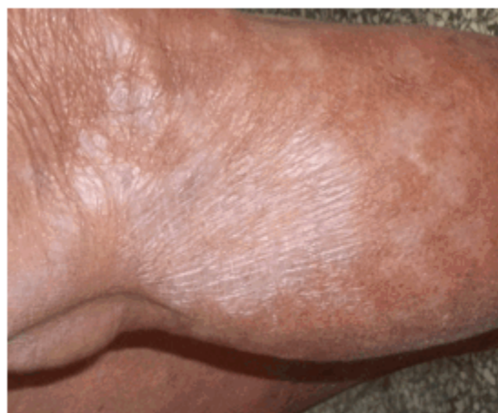
Figura 2. A. Placa marfileña en pierna derecha.