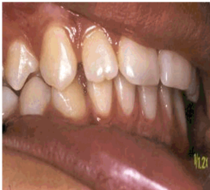
Figura 3. Oclusión después de 8 meses de tratamiento con las pistas.

Como bien señala Planas las pistas actúan por el principio de acción por presencia lo que se entiende como el ligero movimiento dentario de liberación linguo-vestibular que se produce como consecuencia de la colocación de una simple placa palatina o lingual de acrílico.