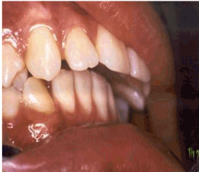
Figura 1. Oclusión antes del tratamiento.

Se toman impresiones de ambas arcadas dentarias con alginato, vaciadas en yeso piedra para obtener los modelos de estudio, se le realiza además un estudio radiográfico pero nos vemos limitados a confeccionar un estudio teleradiográfico por su carencia en la provincia.