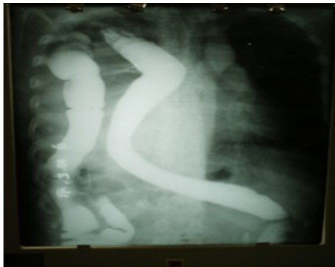
Figura 2. Radiografía de colon por enema en la cual se observa parte del colon derecho, transverso y estómago ascendidos a la cavidad torácica.